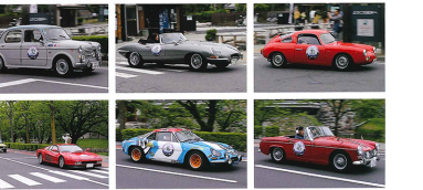
松本城を先手に2日目の最終スタートを待てる参加者も。初日は雨が降って爽やかにスタートした。親子で参加する人も多かった。