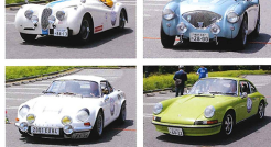
2日目の最終PC道路は、アルファ Romeo の公道に設定。50分、100分、120分、150分の4種類のコースがあり、参加者は各自のペースで楽しむことができる。親子で参加する人も多かった。