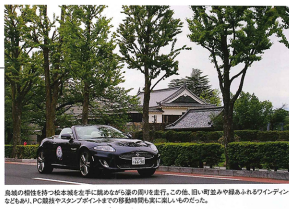
会場の特徴として松本市中心部にある歴史博物館のそばに、この他、50、60年代のクルマのファンデイングにもなじみ、PC道路やスタンプラリーなどの移動も楽しめる。親子で参加する人も多かった。

初参加のイベントを満喫。参加車が集まる様子が見られる。親子で参加する人も多かった。