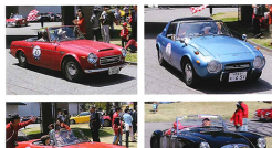
ゴールの瞬間にゴールテープが舞い上がる。参加車が集まる様子が見られる。親子で参加する人も多かった。